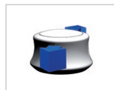
Przybliżanie / Oddalanie