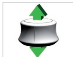
Przesuwanie do góry i w dół